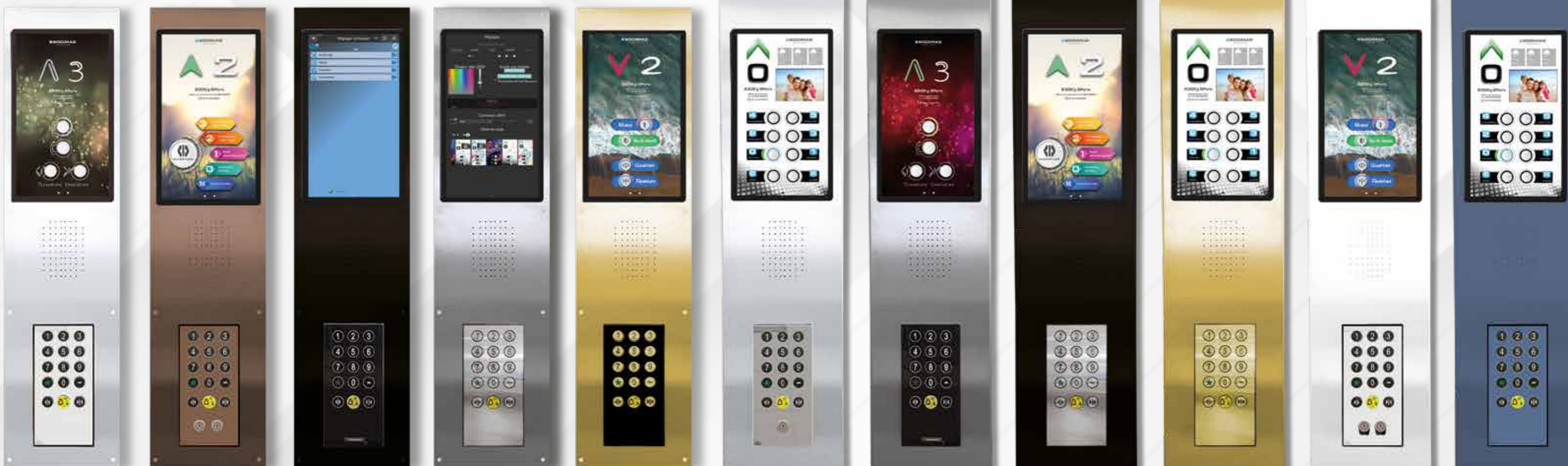
Mode IHM / HMI

A complete range that incorporates Design and functionality !